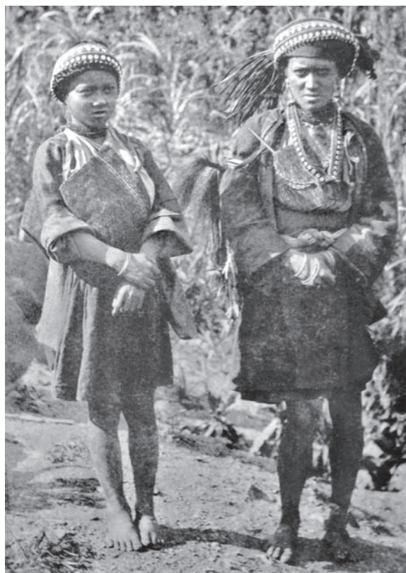
Плем'я цоу. Святковий одяг

Зібрані Торії матеріали дають змогу сучасним дослідникам реконструювати окремі форми та елементи внутрішньо-племенних взаємин періоду зародження та раннього функціонування соціальних інституцій на прикладі аборигенів Тайваню.