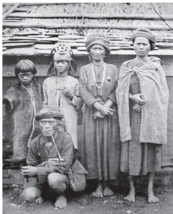
Жінки племені рукаї

Заснування університету в Тайбеї (1928 р.) дало змогу працювати під його егідою Науковій комісії, яка досліджувала етнографічні особливості аборигенів острова. На основі проведеної роботи співробітники Тимчасової комісії з до-