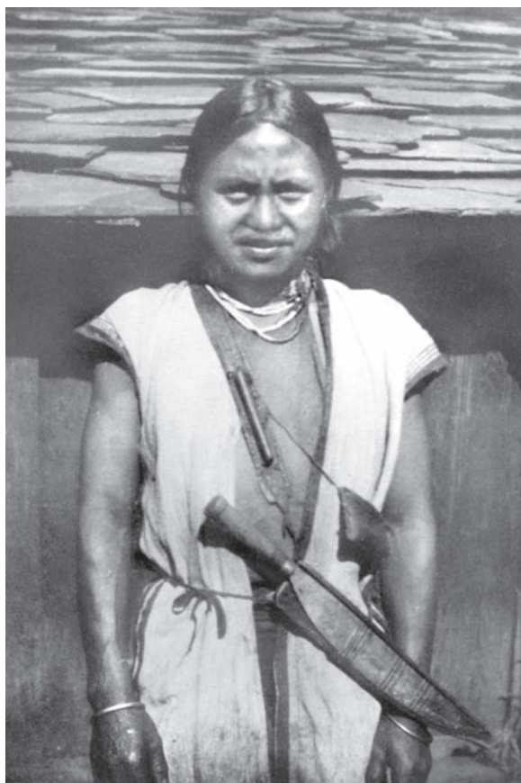
Чоловік племені бунун