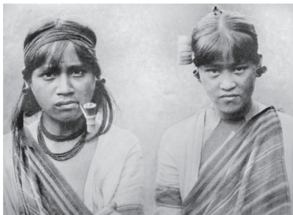
Представники племені атаял

Обидва дослідники – Торії та Іно – займалися етнографією Тайваню, але кожен з них мав власну специфіку: Іно приділяв значну увагу китайським письмовим джерелам, а Торії був «чистим польовиком», досліджував найвіддаленіші від «цивілізації» поселення аборигенів.