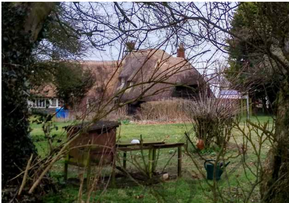
Ил. 3. Житловий будинок XIX ст. с-ще Евбері, Англія. 2018 р.