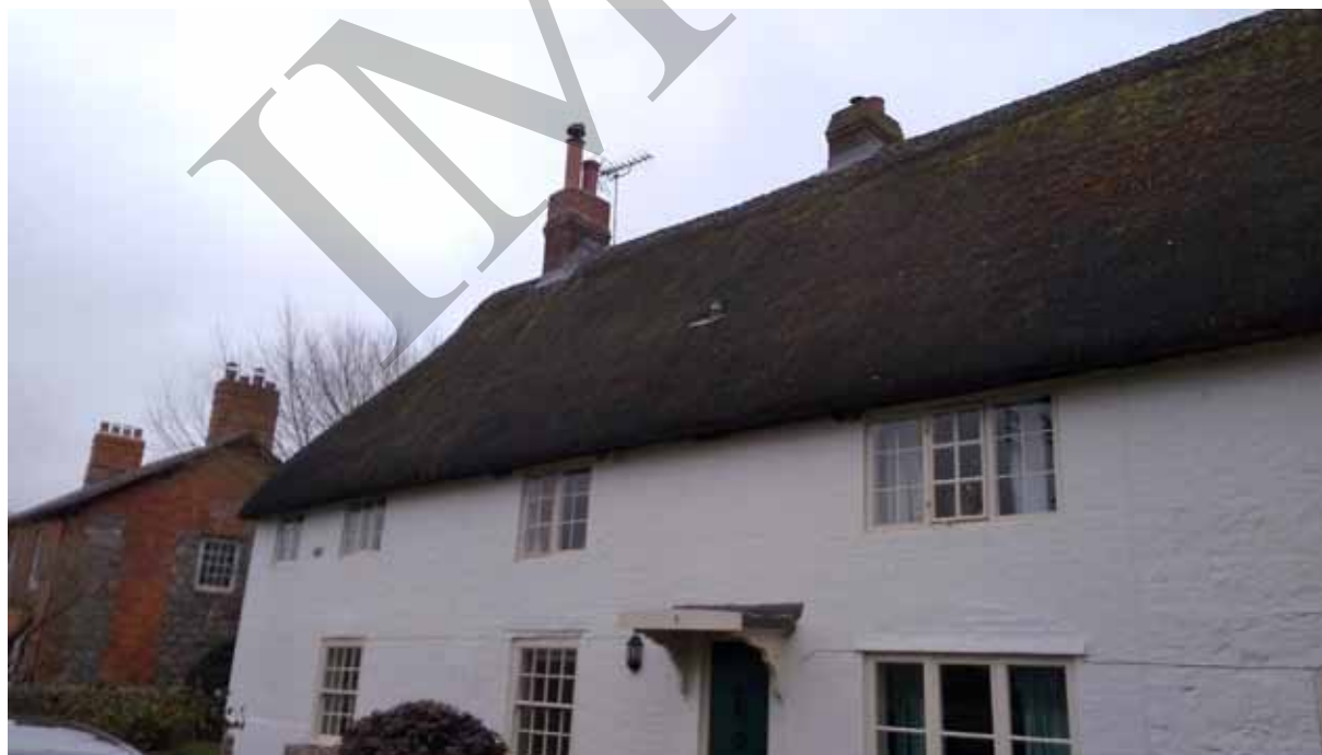
Ил. 4. Житло та садиба XIX ст. с-ще Евбері, Англія. 2018 р.