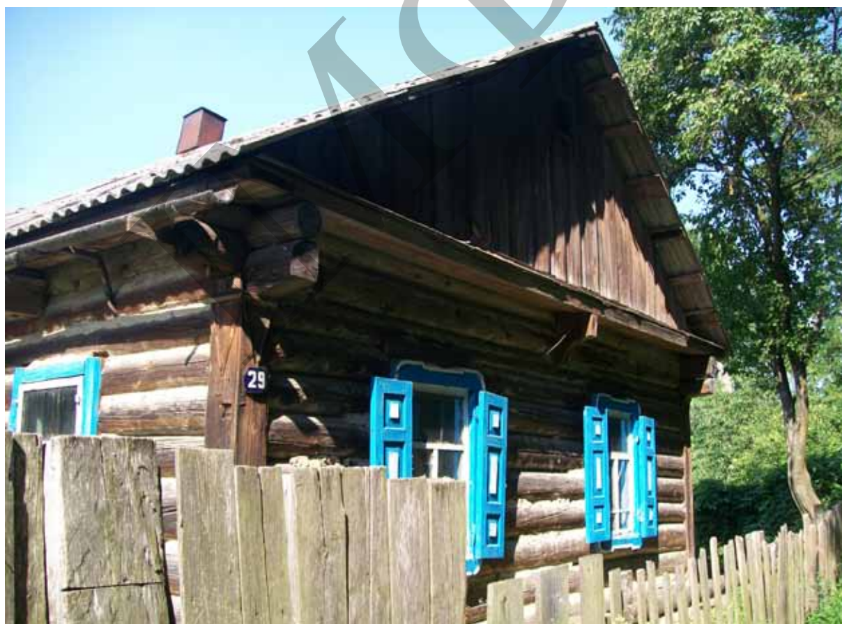
Ил. 2. Житло середини – другої половини ХХ ст. сmt Любеч Ріпкинського р-ну Чернігівської обл. 2016 р.